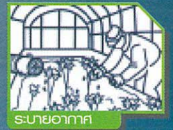
ระบายอากาศ