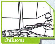
เข้าชิ้นงาน