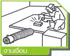
งานเชื่อม