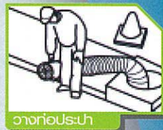
วางท่อประปา