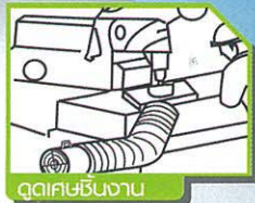
อุตสาหกรรมงาน